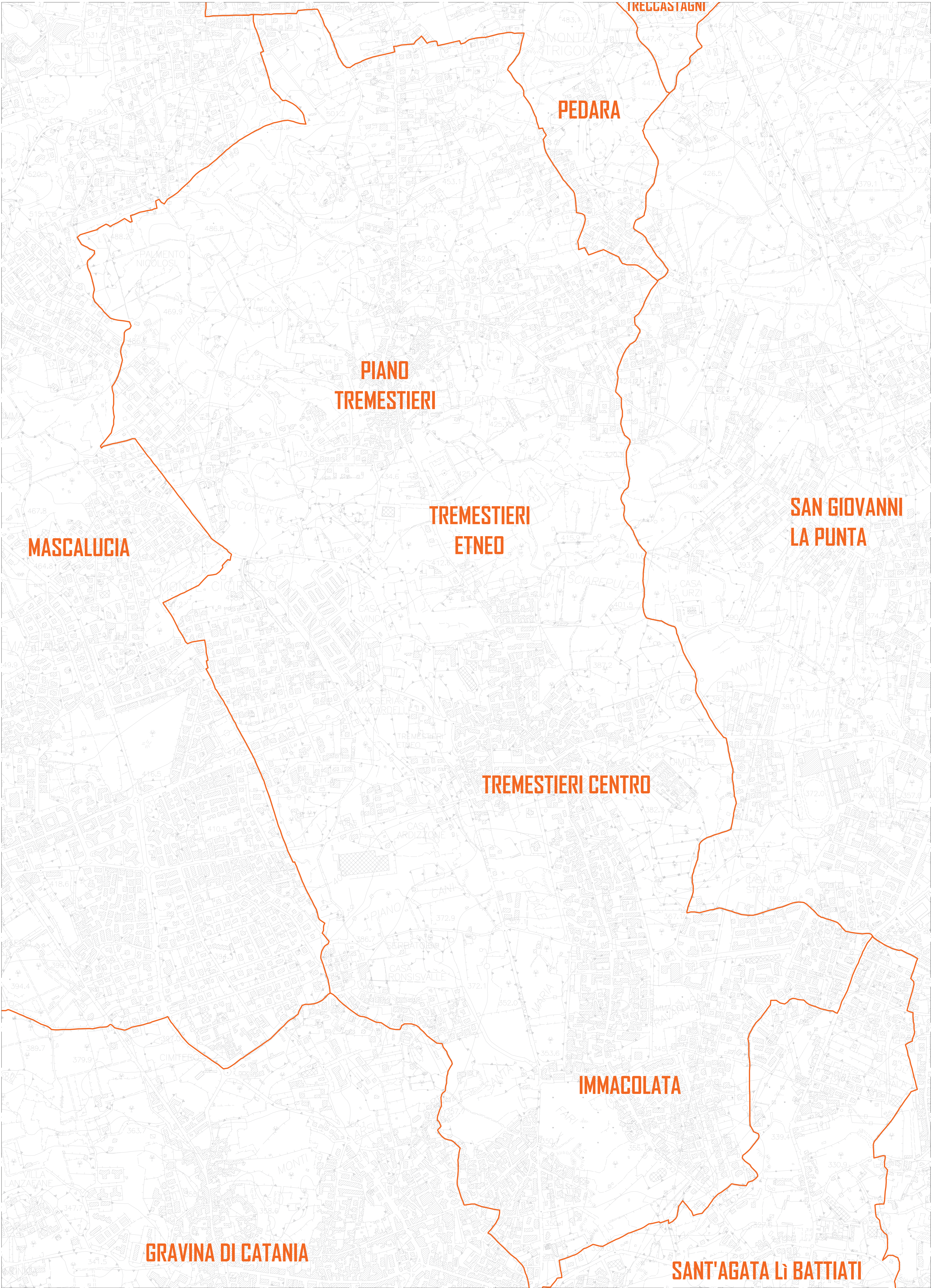
TREMESTIERI ETNEO - PIANO TREMESTIERI - TREMESTIERI CENTRO - IMMACOLATA